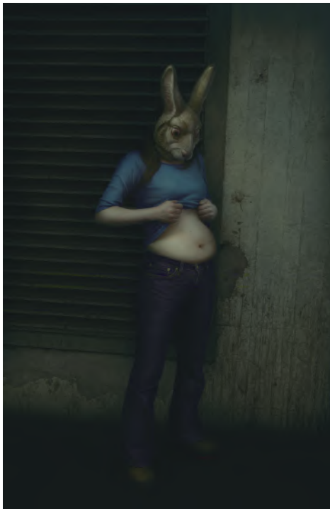
Rabbit, digital photo painting, 70×45.5cm, 2009