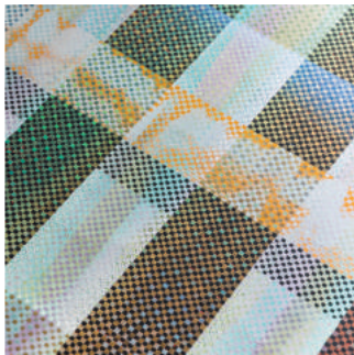
C/U_m-m_(b)_II (部分) 2018

オープニングレセプション Opening Reception : 6. 15 (fri.) 15:00 - 18:00