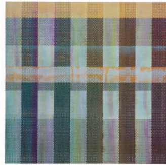
C/U_m-m_(b)_II 2018

この度イムラアートギャラリーにて、画家・川人綾の初の個展を開催するはこびとなりました。