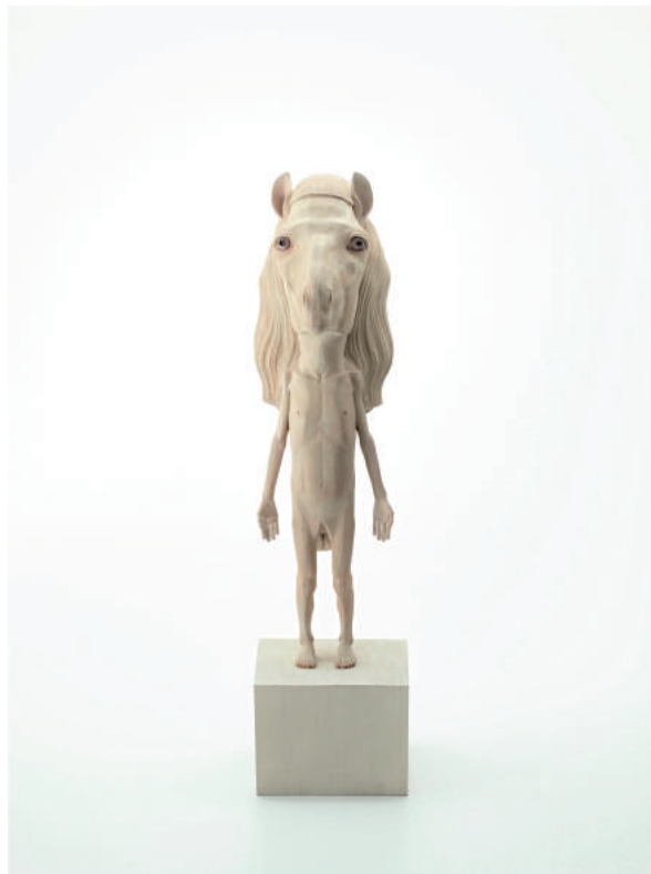
静かな隣人 Silent neighbor 2019 楠、水彩