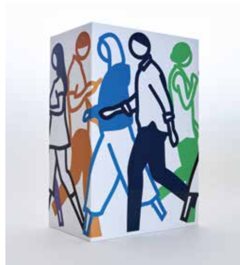
ジュリアン・オピー《Day and Night》シルクスクリーン、アクリルブロック、39.5cm×25.8×16cm、2021

1965年イギリス生まれ。YBA (Young British Artists) を代表する作家として1990年代以降の現代美術を牽引。生と死、時間、信仰といった根源的テーマを扱い、ホルマリン作品やスポット・ペインティングなど革新的な表現によって国際的な評価を確立した。現代社会における価値観や人間存在への問いを投げかけ続けている。