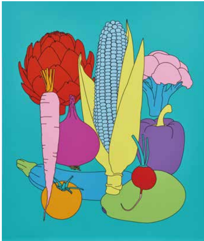
《Domesticated Nature: Vegetables》シルクスクリーン、紙、85cm×72cm、2022

時間：12:00 - 18:00 / 場所：imura art gallery ※日曜・月曜・祝・夏季休業日休廊