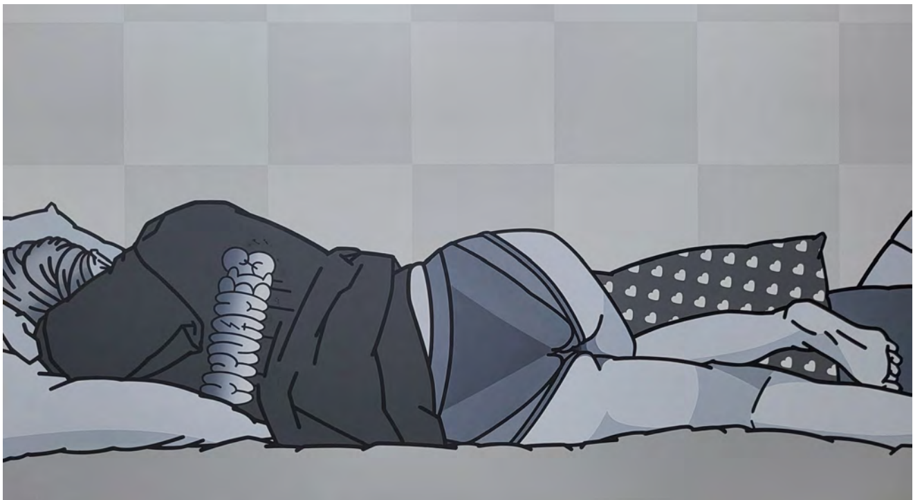
《MY NAME IS》Acrylic on cotton panel, 165.8×91cm, 2023

また、渋谷ヒカリエ 4 階のヒカリエデッキでは、壁面アートプロジェクト第 5 弾として、極並の作品を公開中です。本展に出品している原画とあわせて、是非ご高覧くださいませ。