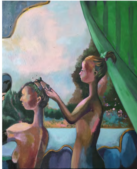
《Pink Moon》 Oil on Canvas 46.3x37.5cm, 2023