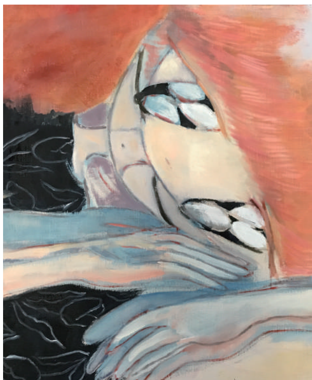
石井海音《起きた人》キャンバスに油彩、507mm×420mm、2021 年

本展では、新作約 9 点を展覧いたします。独自の絵画の試みにぜひご対峙ください。