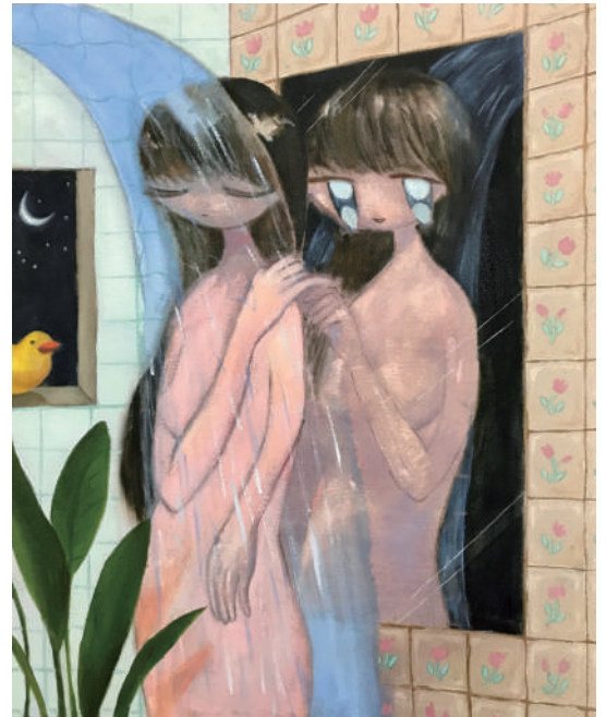
石井海音《お風呂のおぼけ》 キャンバスに油彩、606mm×500mm、2021年