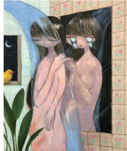
Amane Ishii 《お風呂のおぼけ》 2021, Oil on canvas, 606mm×500mm