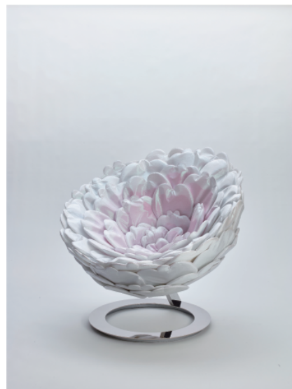
《PEONY》約 85×100×100cm、2022 年

京都国立近代美術館には、メンフィスのために制作された「タワラヤ」が収蔵されています。また、香港に昨年オープンした美術館 M+ には、147 点の作品が買い上げられコレクションされており、海外での注目も高まっています。本展では、最新作の椅子「PEONY」と「SAKURA」の 2 点を発表いたします。自然との共生をイメージして制作された作品から、梅田の尽きることのないデザインの源泉の一端を感じていただければと思います。